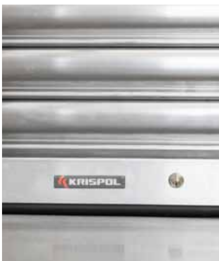
ZAMEK RYGLUJĄCY w dolnej listwie