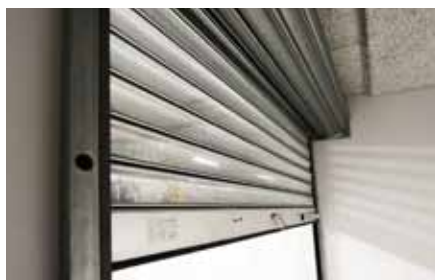
KRATA PERFOROWANA R2 SP