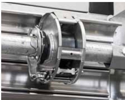
ZABEZPIECZENIE w przypadku pęknięcia sprężyn