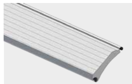
PROFIL STALOWY OCIEPLONY o wysokości krycia 95 mm