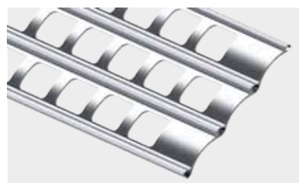
PROFIL ALUMINIOWY SZTANCOWANY o wysokości krycia 60 lub 85 mm