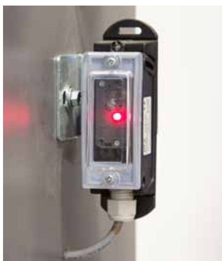
FOTOKOMÓRKA jednokierunkowa IP65