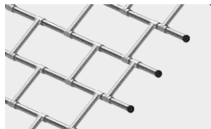
RURKA STALOWA PROSTA POŁĄCZONA POPRZECZKAMI o wysokości krycia 120 mm