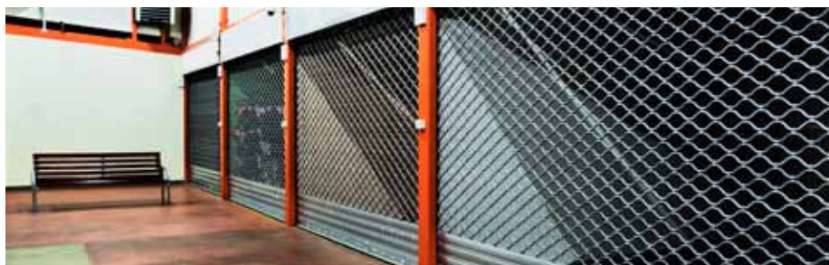
KRATA ROLOWANA SINUSOIDALNA R2 S5