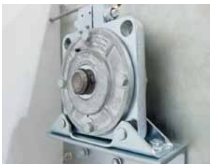
HAMULEC INERCYJNY stosowany w bramach i kratkach z napę- dem rurowym