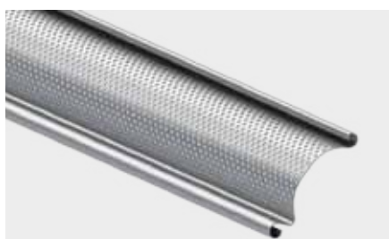
PROFIL ALUMINIOWY LUB STALOWY PERFOROWANY o wysokości krycia 91 mm

Wygląd i budowa krat rolowanych zależą od miejsc, w których się je montuje i funkcji, które pełnią. W pomieszczeniach, które powinny być nie tylko bezpieczne, ale także wyeksponowane sprawdzają się kraty ze stalowych rurek prostych lub giętych sinusoidalnie. Do nowoczesnych wnętrz, wymagających wysokiego poziomu wentylacji doskonale pasują kraty aluminiowe z otworami w kształcie prostokątów. Kraty ze stalowych i aluminiowych perforowanych profili zapewniają jednocześnie przesłonę optyczną i przepuszczalność powietrza na poziomie 28%. Kraty aluminiowe i kraty stalowe zbudowane z profili perforowanych można lakierować na jeden z 200 kolorów palety RAL.