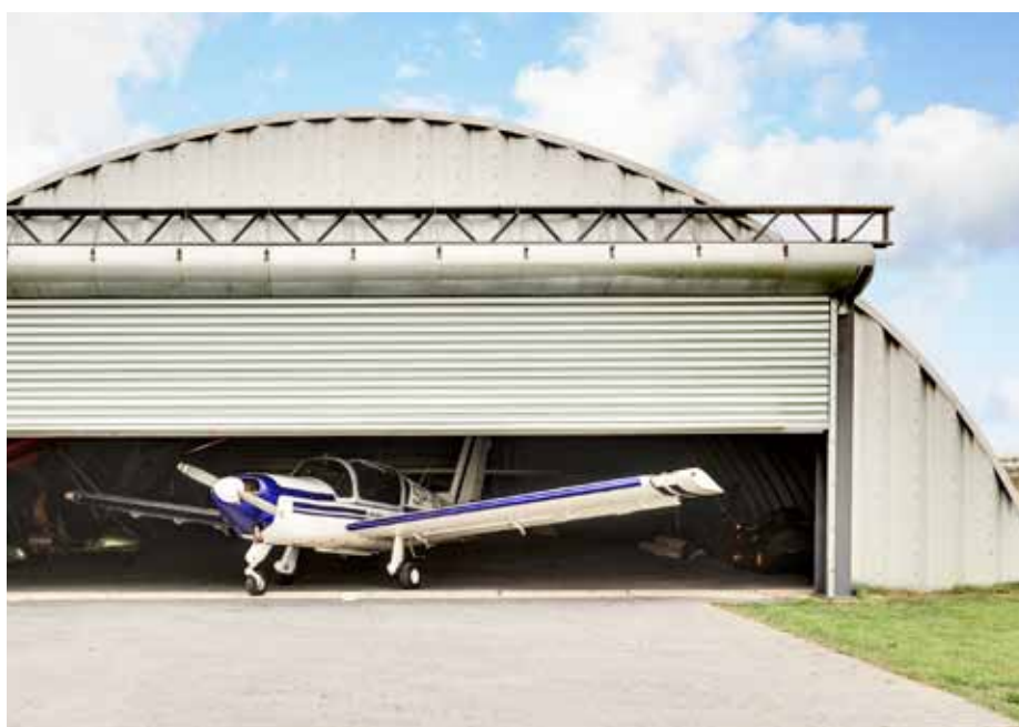
BRAMA R1 SS Z JEDNOŚCIENNYCH PROFILI STALOWYCH

Ze względu na swoją wytrzymałość umożliwia tworzenie bardzo szerokich konstrukcji