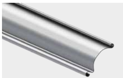
PROFIL ALUMINIOWY JEDNOŚCIENNY o wysokości krycia 91 mm