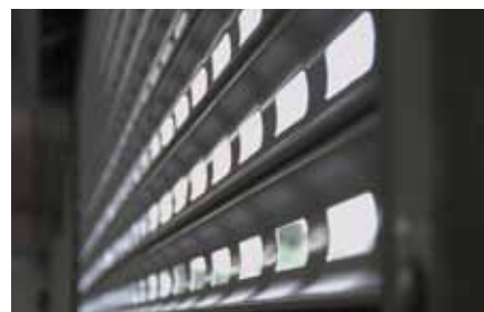
KRATA ROLOWANA R2 AM