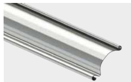
PROFIL STALOWY JEDNOŚCIENNY o wysokości krycia 91 mm