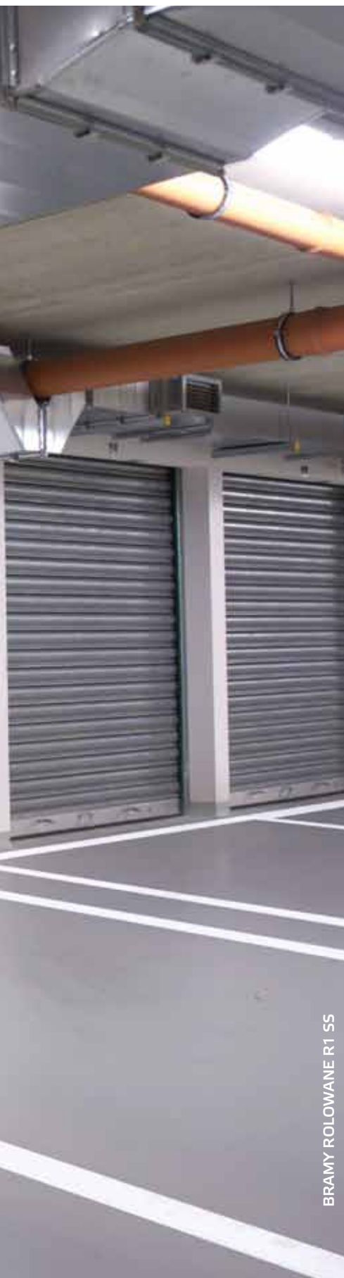
BRAMY ROLOWANE R1 SS

Bramy przemysłowe mają bardzo różne przeznaczenia. Produkujemy je dokładnie według wskazanych wymiarów, stosując rozwiązania dopasowujące urządzenia do różnych zadań i warunków zabudowy. Są to m. in. profile z okienkami oraz profile wentylacyjne, a w bramach zimnych profile perforowane. Ciekawą propozycją jest tzw. „brama z tatuażem”, czyli z indywidualnie zaprojektowaną perforacją pancerza, np. nawiązującą wzorem do prowadzonej w danym obiekcie działalności.