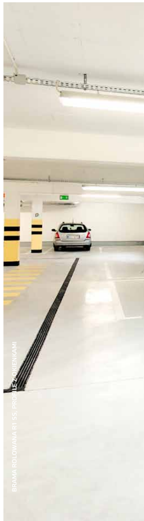
BRAMA ROLOWANA R1 S5, PROFILE Z OKIENKAMI