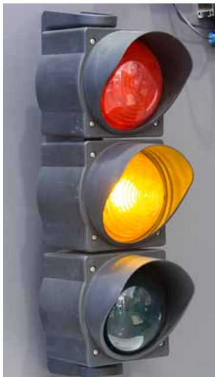
SYGNALIZATOR ŚWIETLNY czerwono/żółto/zielony

Kraty oraz bramy rolowane wyposażone są w zabezpieczenie przed opadnięciem pan- cerza w przypadku zerwania sprężyn lub zintegrowany w napędzie hamulec bezpieczeń- stwa. Wszystkie rozwiązania można rozbudować o dodatkowe zabezpieczenia - lampy sygnalizacyjne, przydatne w dużych obiektach przemysłowych lub fotokomórki, dzięki którym krata unosi się automatycznie po wykryciu przeszkody w świetle wejścia. Po- dobnie działają zabezpieczenia krawędziowe, zatrzymujące i unoszące kratę po natra- fieniu na przeszkodę.