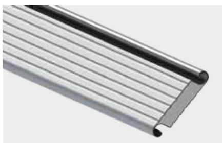
PROFIL ALUMINIOWY OCIEPLONY o wysokości krycia 100 mm

Bramy przemysłowe mają bardzo różne przeznaczenia. Produkujemy je dokładnie według wskazanych wymiarów, stosując rozwiązania dopasowujące urządzenia do różnych zadań i warunków zabudowy. Są to m. in. profile z okienkami oraz profile wentylacyjne, a w bramach zimnych profile perforowane. Ciekawą propozycją jest tzw. „brama z tatuażem”, czyli z indywidualnie zaprojektowaną perforacją pancerza, np. nawiązującą wzorem do prowadzonej w danym obiekcie działalności.